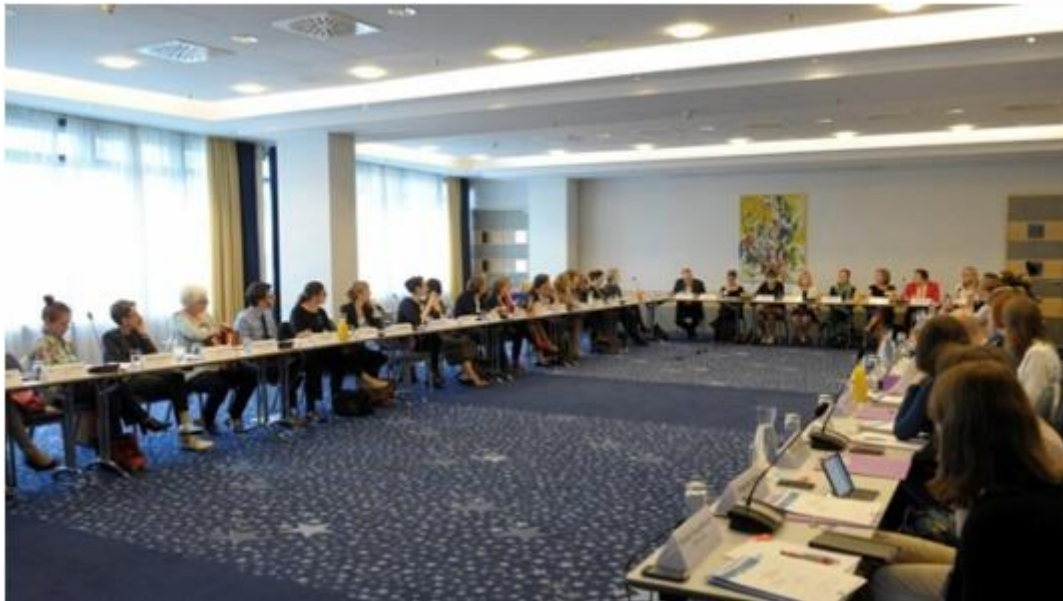
Angeregte Diskussionsrunde

Den Schwerpunkt des Programms bilden konkrete Politikmaßnahmen und konkrete Praxisbeispiele. Es sollen sowohl Chancen als auch Stolpersteine für die Politikumsetzung aufgezeigt und die Möglichkeiten bzw. Herausforderungen hinsichtlich der Übertragbarkeit auf andere Staaten hervorgehoben werden.