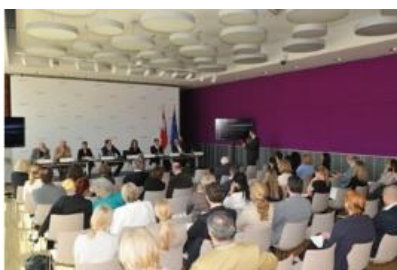
Podiumsdiskussion mit Erfahrungsaustausch zwischen Deutschland und Österreich (BMF/Grondahl)

Der Einfluss der Besteuerung auf die Geschlechterverhältnisse wird derzeit international ebenso diskutiert wie die Frage, wie eine gleichstellungssensible Besteuerung aussehen sollte. In Österreich und in Deutschland bestehen zwischen Frauen und Männern nach wie vor beträchtliche Unterschiede im Einkommen. Beide Länder weisen eine über dem EU-Durchschnitt liegende Erwerbsbeteiligung von Frauen auf, jedoch arbeiten in beiden Ländern Frauen zu einem im EU-Vergleich überdurchschnittlich hohen Anteil in Teilzeit.